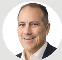
Andreas Schönenberger CEO Sanitas

FH SCHWEIZ darf auf eine langjährige Zusammenarbeit mit dem Krankenversicherer Sanitas zurückblicken. Mitunter ein guter Anlass, Einblicke in die Welt einer der grossen Schweizer Krankenversicherer zu werfen. Als FH-SCHWEIZ-Mitglied profitierst du sowie im gleichen Haushalt lebende Familienangehörige zudem von bis zu 10 % Kollektivrabatt auf ausgewählte Zusatzversicherungen der Sanitas.