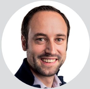
Christian Wasserfallen, presidente FH SVIZZERA, consigliere nazionale

«Questo opuscolo dovrebbe mettere in risalto l'importanza della formazione continua in termini generali, anche con formazione «on the job», e in particolare dall'ottica di chi si diploma in scuole universitarie professionali, del mercato del lavoro e delle scuole stesse. Ma dovrebbe anche fare chiarezza e fornire una comprensibile visione d'insieme.