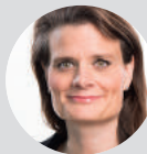
Martina Hirayama Staatssekretärin für Bildung, Forschung und Innovation