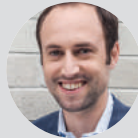
Christian Wasserfallen Präsident FH SCHWEIZ Nationalrat FH-Absolvent

Exklusive erste Erkenntnisse zur vertieften Befragung der Weiterbildung in der aktuellen FH-Lohnstudie 2019.