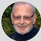
Niklaus Brantschen Zen-Meister, Mitgründer des Lassalle-Instituts

Was lässt uns im Grunde leben, aus welchen Quellen schöpfen wir oder kurz: Was meint Spiritualität und wie können wir sie praktizieren? Moderation: Rainer Kirchhofer, Vorstand FH SCHWEIZ.