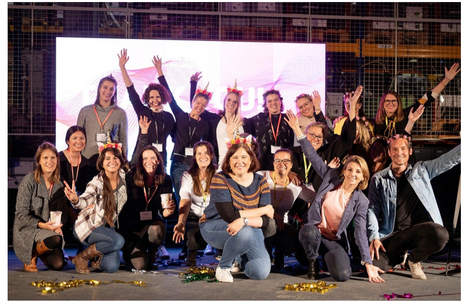
Der grösste Hackathon für Frauen in der Schweiz fand Anfang November in Zürich statt.