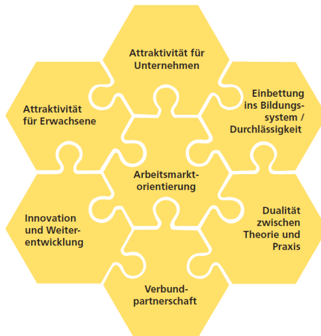
Grafik 1: Prämissen Höhere Fachschulen